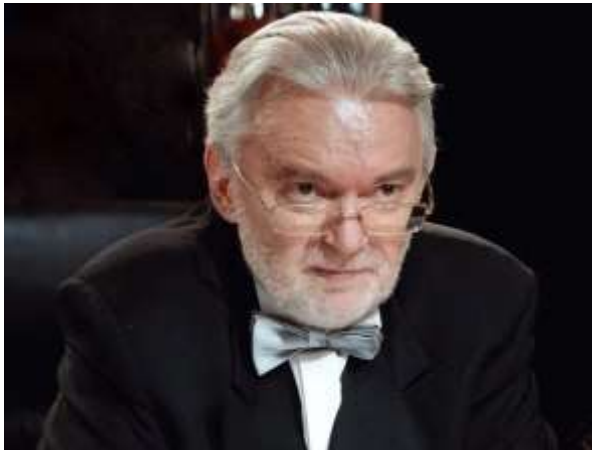
Борис Левин «Что?Где? Когда?» Энциклопедия головоломок»