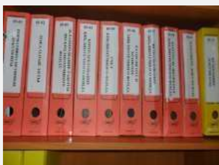
ГБОУ № 3

это простейший классификатор, позволяющий быстро разложить документы по папкам (делам) для оперативного их поиска в случае надобности. От того, насколько качественно она составлена, зависят оперативность работы с документами и их сохранность.