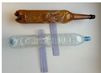
Рис. 5. Адаптированные бутылки, закрепленные на небольшой палке

4. Подбор / создание адаптированного приспособления для переливания. Использование обычных бутылок невозможно. Используются адаптированные бутылки, закрепленные на небольшой палке (рис. 5).