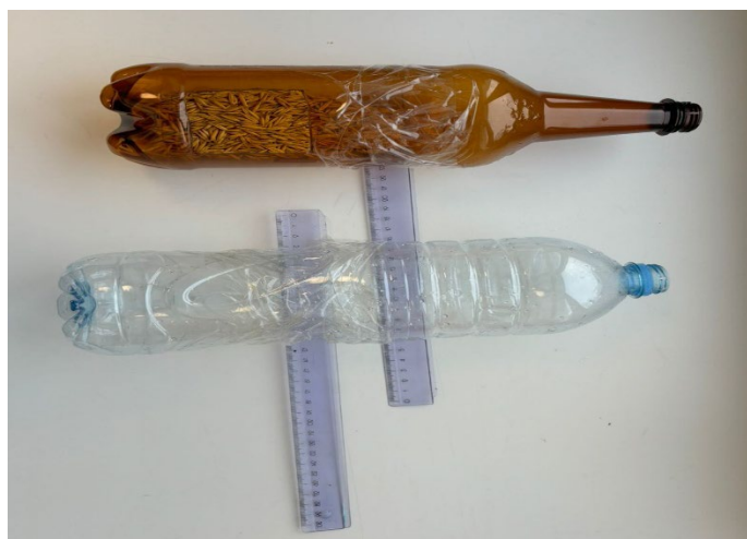
Рис. 5. Адаптированные бутылки, закрепленные на небольшой палке

8. Подбор / создание адаптированного приспособления для переливания. Использование обычных бутылок невозможно. Используются адаптированные бутылки, закрепленные на небольшой палке (рис. 5).