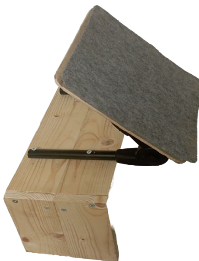
Рис. 2 Планшет с изменяемым углом наклона поверхности для фиксации на коляске или кровати

закрепленной на ней ручкой от коляски) (рис.2).