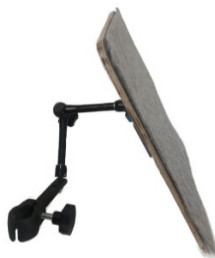
Рис. 3. Планшет с изменяемым углом наклона (шарнирными соединениями)

Однако, в ряде случаев использование планшета данной конструкции затруднено или невозможно. Так, например, при использовании в кровати укладки-подушки типу BodyMap невозможным становится использование стационарной основы планшета. Возникает необходимость преобразования конструкции и использования планшета с изменяемым углом наклона (шарнирные соединения), который крепится непосредственно на каркас кровати или коляски (рис.3).