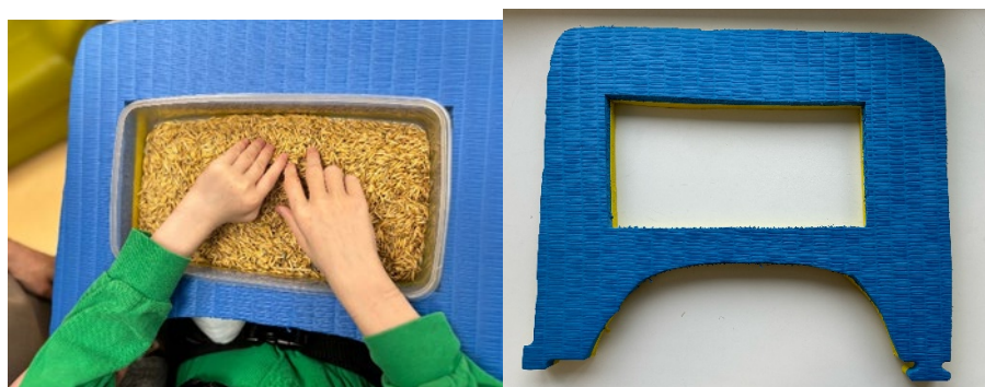
Рис. 4. Основа для фиксации емкости (контейнера) на рабочей поверхности стола / парты

педагога, обусловленному необходимостью одновременно фиксировать емкость и осуществлять физическую помощь обучающемуся в процессе совершения тактильного обследования. Для повышения эффективности осуществления образовательного процесса и сопровождения обучающегося используется адаптация среды, связанная с фиксацией контейнера для материала. Для фиксации емкости на рабочей поверхности (индивидуальный стол или парта) используются специальные удерживающие приспособления, изготовленные из вспененного материала (например: Будо-маты «Ласточкин хвост»), вырезанного по форме стола / парты, с отверстием, соответствующим по размеру и форме используемой емкости (контейнеры, стаканчики для воды, баночки с красками и т.д.) (рис.4).