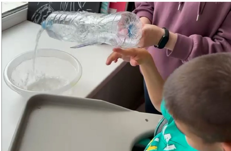
Рис. 6. Использование адаптированных бутылок для совершения самостоятельного переливания жидкости обучающимся с ТМНР

Использование адаптированной бутылки позволяет обучающемуся, не способному к выполнению ротационных движений рукой и опусканию руки вниз, например с лейкой, позволяет самостоятельно поливать цветок в горшке.