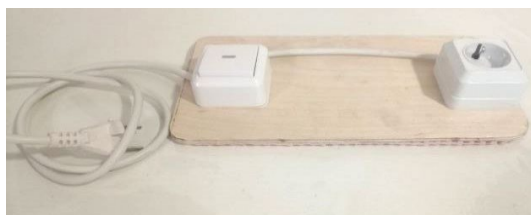
Рис. 1 Адаптер включения электрических приборов с большой клавишей

Отметим, что в образовательной организации отсутствует должность эрготерапевта, функции по адаптации среды для обучающихся с ТМНР реализуются междисциплинарной командой специалистов, в состав которой входят учитель-дефектолог (олигофренопедагог), учитель адаптивной физической культуры.