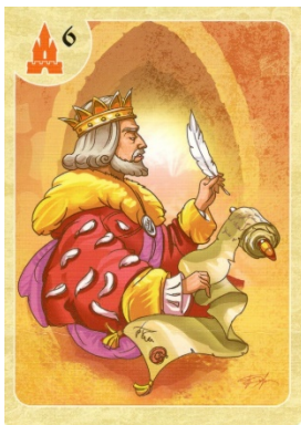
МУДРЫЙ ПРАВИТЕЛЬ ТРОНЕ