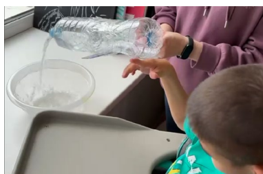
Рис. 6. Использование адаптированных бутылок для совершения самостоятельного переливания жидкости обучающимся с ТМНР

Использование адаптированной бутылки позволяет обучающемуся, не способному к выполнению ротационных движений рукой и опусканию руки вниз, например, с лейкой, позволяет самостоятельно поливать цветок в горшке.