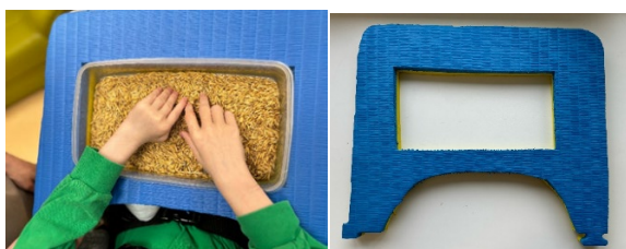
Рис. 4. Основа для фиксации емкости (контейнера) на рабочей поверхности стола / парты

В большинстве случаев при организации тактильного обследования сыпучих или жидких материалов, находящихся в контейнере, с детьми, у которых присутствуют собственные произвольные и / или непроизвольные движения, педагогу необходимо придерживать контейнер на столе. Это приводит к нерациональному использованию ресурса педагога, обусловленному необходимостью одновременно фиксировать емкость и осуществлять физическую помощь обучающемуся в процессе совершения тактильного обследования. Для повышения эффективности образовательного процесса и сопровождения обучающегося, используется адаптация среды, связанная с фиксацией контейнера для материала. Для фиксации емкости на рабочей поверхности (индивидуальный стол или парта) используются специальные удерживающие приспособления, изготовленные из вспененного материала (например, будо-маты «Ласточкин хвост»), вырезанного по форме стола / парты, с отверстием, соответствующим по размеру и форме используемой емкости (контейнеры, стаканчики для воды, баночки с красками и т.д.) (рис.4).